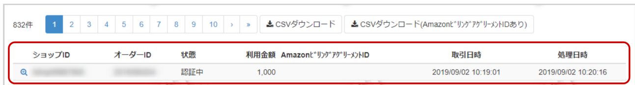
表 取引一覧表示項目